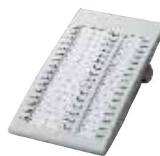
■ KX-T7740 DSS Console