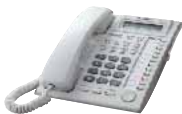
■ KX-T7730 Telefono Proprietario

* E' richiesta una scheda opzionale. Contattate il vostro rivenditore di fiducia o la compagnia telefonica per avere la conferma che il servizio di Caller ID sia disponibile nella vostra zona.